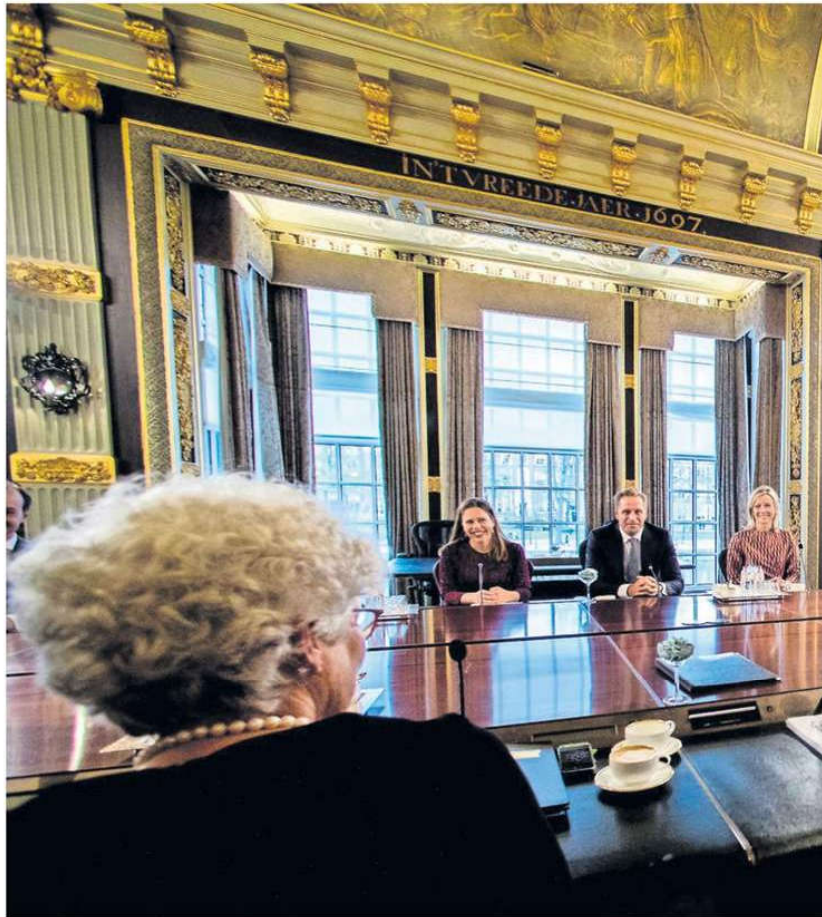
Premier Mark Rutte zit de eerste ministerraad van zijn nieuwe kabinet voor in de Trevesaal op het Binnenhof.

Van de stalinistische schijnprocessen weten we dat de beschuldigde niet alleen de aanklacht moet accepteren, maar ook zichzelf moet beschuldigen. Pas dan is de beschuldiging compleet, en kan de straf beginnen.