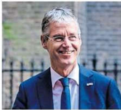
Minister Arie Slob